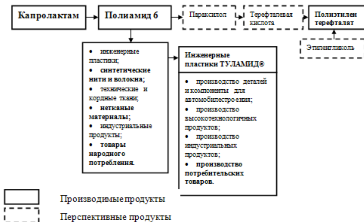
Рисунок 2 – Производственная цепочка на основе получения и переработки Полиамида 6 3

Развитие машиностроения Щекинского района будет отвечать потребностям развивающейся нефтегазохимической отрасли и возрождаемой в Тульской области станкоинструментальной промышленности (снизит зависимость тульских оборонных предприятий от производителей импортного оборудования и создаст мощную производственную базу для удовлетворения потребностей отечественных и зарубежных машиностроителей).